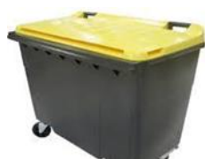
Pour tous les emballages (sauf le verre)