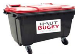
Pour les ordures ménagères

Nous vous invitons à vous associer à notre démarche